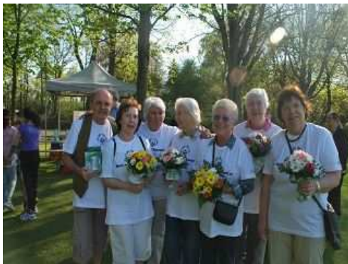
Bild: Mitglieder der Wanderabteilung