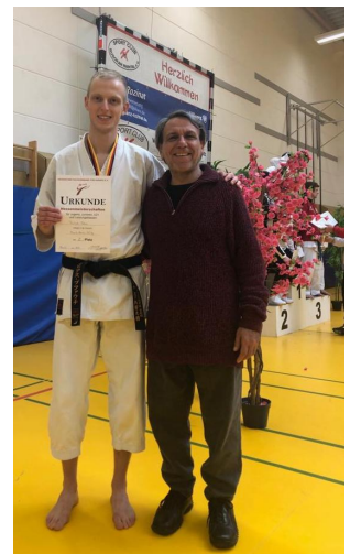
Bild: Der Schüler und sein Meister