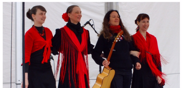
Bild: Die kleinen und großen Tänzerinnen des FTV begeisterten das Publikum.