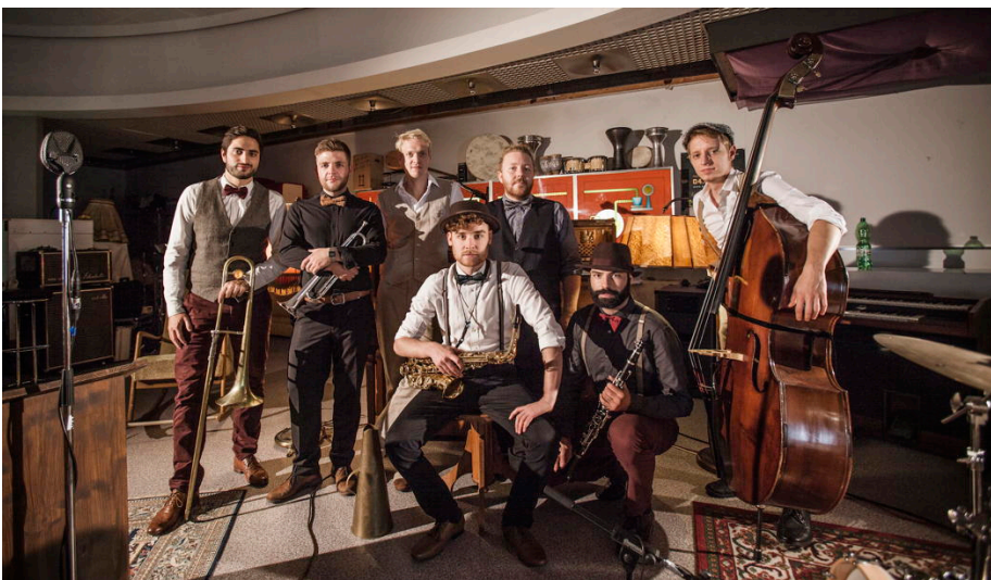
Bild: Huggee Swing Band

SWING ist längst mehr als nur eine Musikrichtung, er ist vielmehr eine Lebenseinstellung die gute Laune macht. Und genau das möchten die „Huggees“ mit ihrer Musik vermitteln. 2012 von Studenten des Jazz-Studiengangs in Mannheim gegründet, haben sich die 7 Profimusiker schnell einen Namen in der Jazz und Swingtanz-Szene gemacht. Inzwischen haben sie sich auf vielen nationalen und auch internationalen Festivals in die Herzen der Zuhörer gespielt. Aktuell arbeiten sie an der Fertigstellung ihrer zweiten CD „Night Mood“, die im Oktober offiziell veröffentlicht wird.